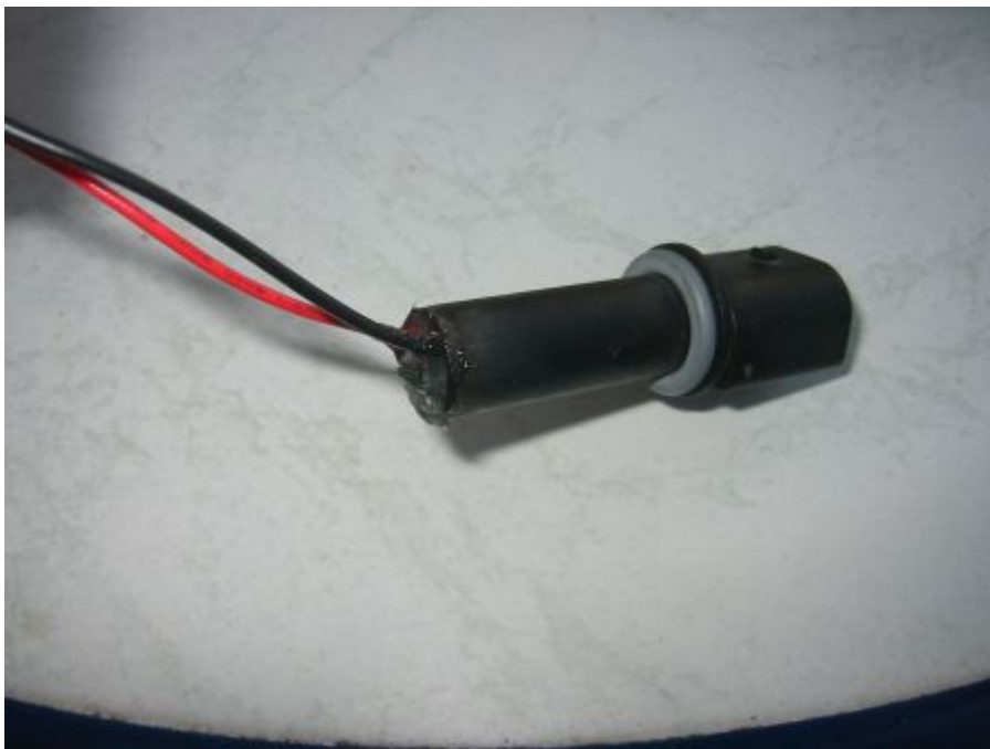
Bild am Beispiel des E36 Steckers

Der Stecker sollte nun mit Dichtmasse / Montagekleber von hinten gefüllt werden – somit ist ein Kurzschluss ausgeschlossen (Achtung: Fehler auf dem Bild – hier ist nur ein Inverter eingelötet – es müssten 2 Inverter je Stecker eingelötet werden, also insgesamt 4 Kabel in den Stecker führen):