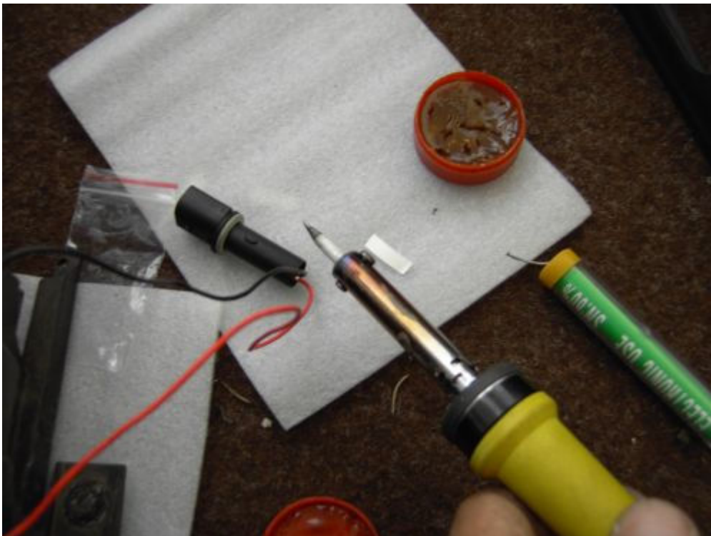
Bild am Beispiel des E36 Steckers

Die alte Standlichtbirne aus dem Sockel entnehmen. Der Sockel wird nun als Stecker für die neuen Standlichtringe verwendet. Dazu werden die beiden Kabel des Inverters (Schwarze Box) direkt in die Birnenfassung gelötet. Dabei ist die Polung besonders wichtig. Eine falsche Polung würde Inverter und Ringe zerstören. Das Rote Kabel am Inverter ist das Plus (+) Kabel. Im Stecker unseres BMWs muss die Belegung im Fahrzeug zusammen mit dem aus dem Scheinwerfer entnommenen Standlichtbirnensockel nachgeschaut werden. Das vom Fahrzeug kommende braune Kabel ist in der Regel die Minus (-) Seite. Dies kann durch einfache Sichtprüfung der anderen Steckerseite am Fahrzeug überprüft werden. Sicherheitshalber kann die Polung aber auch am Fahrzeug nachgemessen werden. Nun die Kabel einlöten. Auf dem folgenden Bild ist nur ein Inverter bereits in den Stecker eingelötet – der 2. muss noch hinzugelötet werden, sodaß 2 Inverter mit je einem Standlichtbirnenstecker verbunden sind: