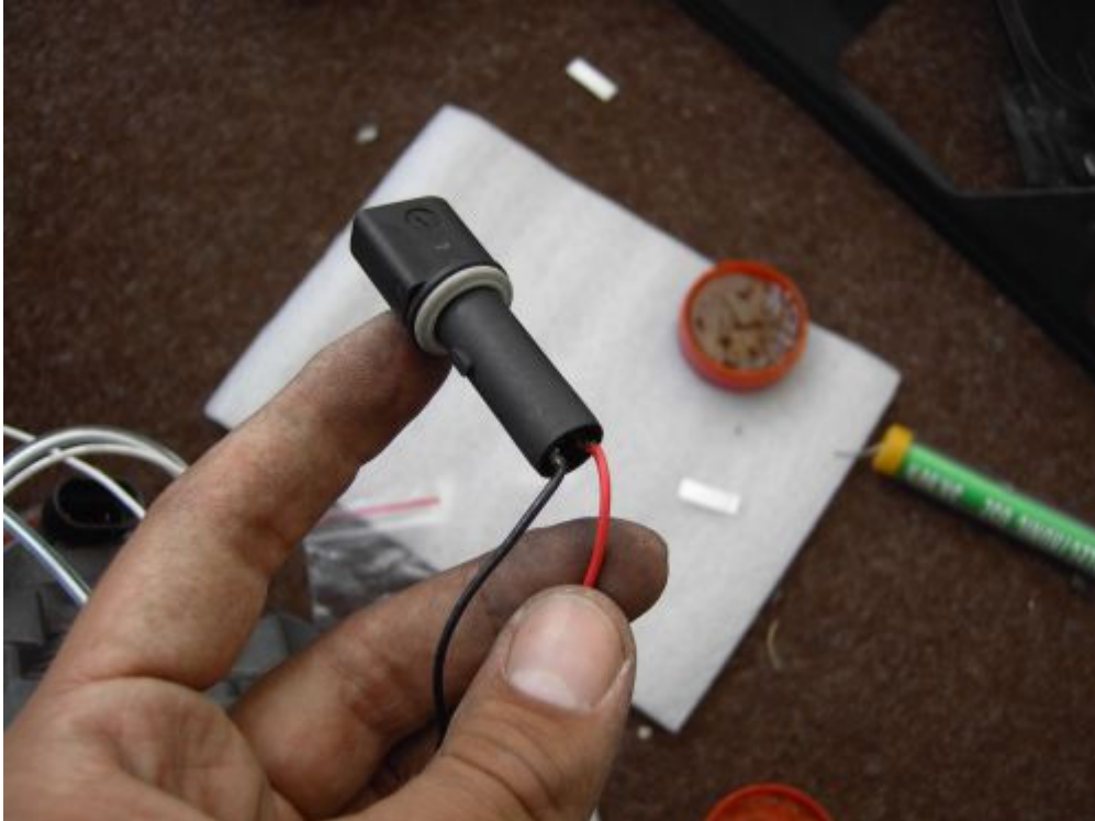
Bild am Beispiel des E36 Steckers

Der Stecker sollte nun mit Dichtmasse / Montagekleber von hinten gefüllt werden – somit ist ein Kurzschluss ausgeschlossen (Achtung: Fehler auf dem Bild – hier ist nur ein Inverter eingelötet – es müssten 2 Inverter je Stecker eingelötet werden, also insgesamt 4 Kabel in den Stecker führen):